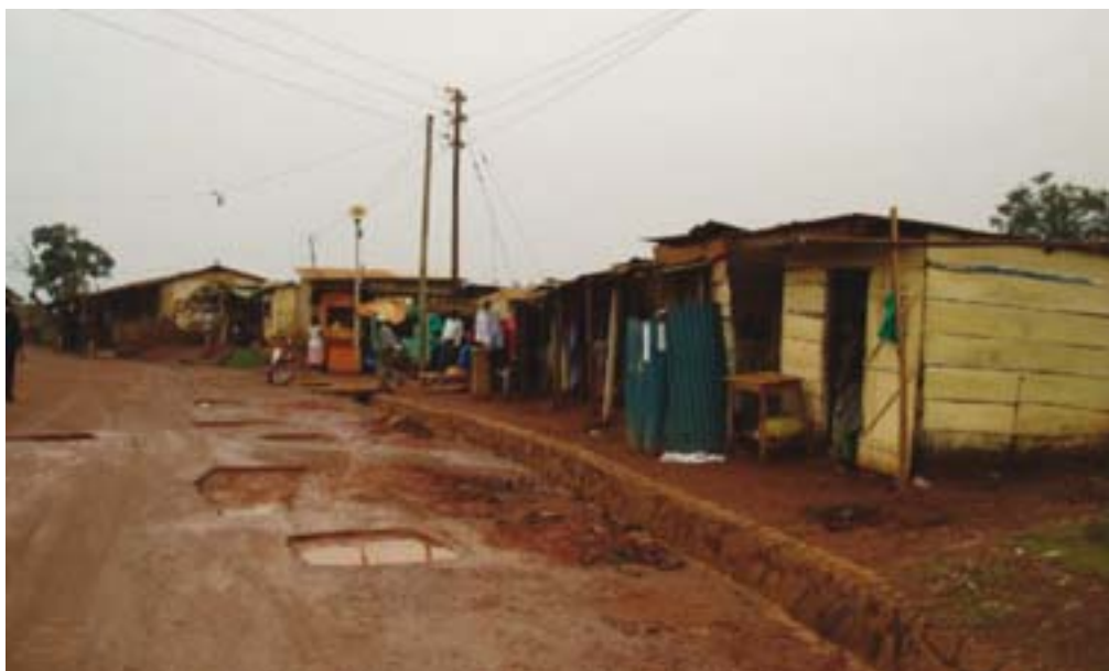
Planker og bølgeblekk preger boligstandarden mange steder i Kampala.