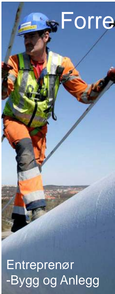
Entreprenør -Bygg og Anlegg