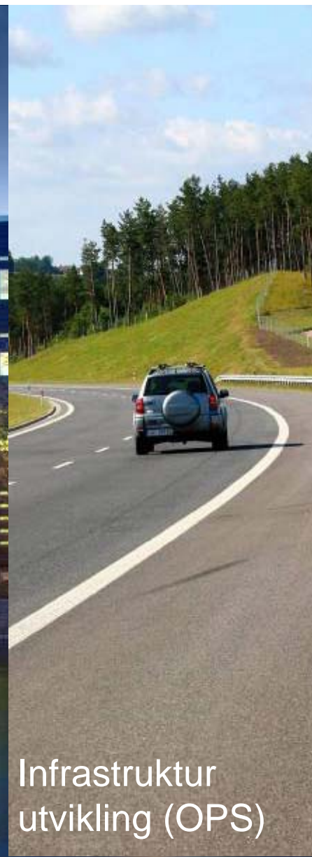
Infrastruktur utvikling (OPS)