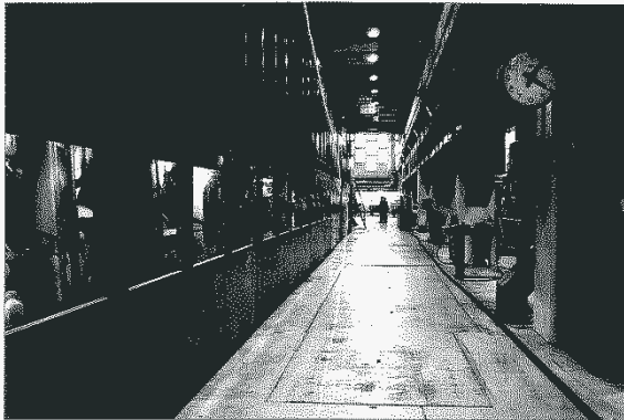
Det blir tomt i fabrikkhallene på Follum etter 31. mars.