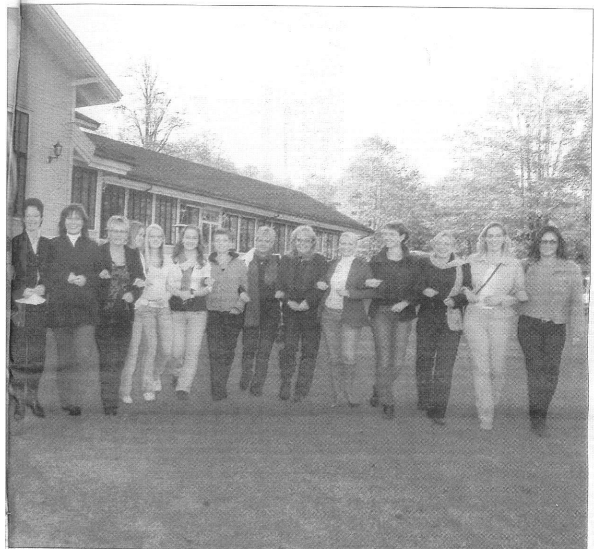
Den nye kvoteringsloven ønsker flere kvinner inn i tunge styreverv. Dette er den første samlingen i prosjektet «Female Future»- et talentprosjekt med sikte på å kvalifisere og synliggjøre kvinner.