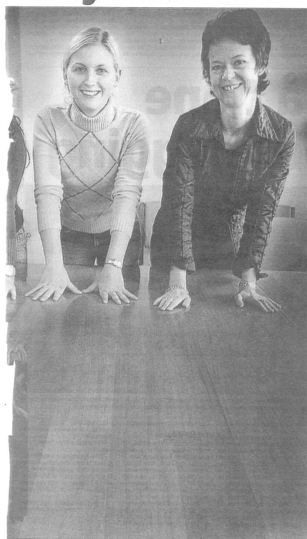
PERMANENT I STYREROMMET: Disse damene