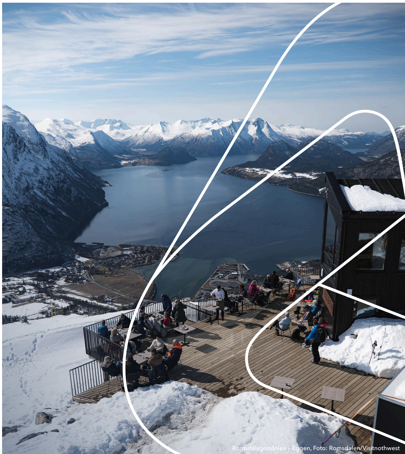
Romsdalsgondolen - Eggen