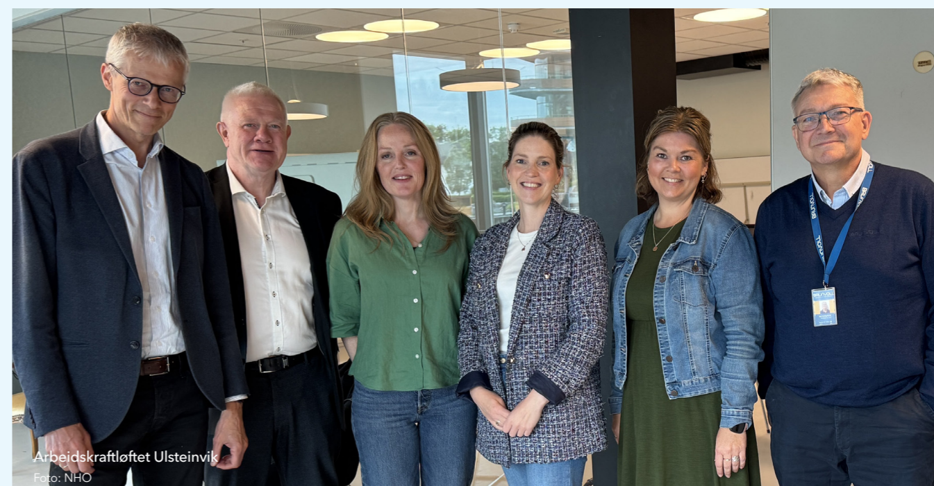
Arbeidskraftløftet Ulsteinvik

I løpet av året har vi hatt flere vellykkede arrangement. Vi startet året tradisjonen tro med Næring i Nordvest i Oslo, kvelden før NHOs årskonferanse. Kvelden ble innledet av NHO president Svein Tore Holsether, konsernsjef i Yara, og avrundet med et innlegg av Venstres nestleder Sveinung Rotevatn. Mørebenken stilte opp til panelsamtale.