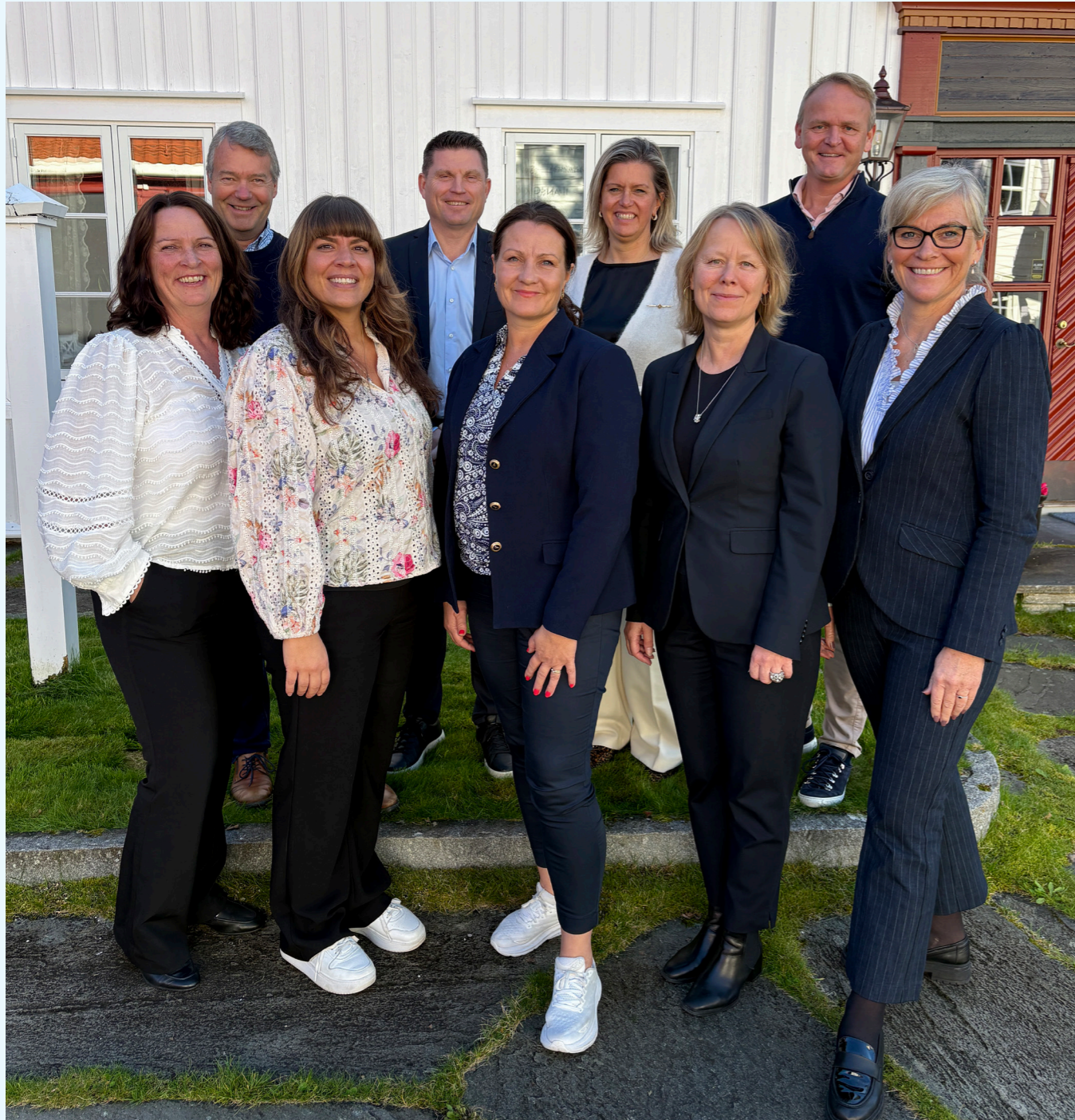
Britt Flo ikke var til stede da bilde ble tatt.