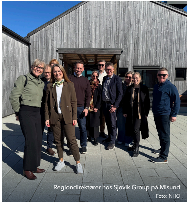
Regiondirektører hos Sjøvik Group på Misund

I løpet av året har vi vært på bedriftsbesøk til store og små bedrifter i hele fylket. Besøk hos medlemsbedriftene er verdifulle, og de gir god innsikt i hvilke utfordringer og temaer som opptar bedriftslederne. Dette gir oss et bedre grunnlag for å jobbe for deres saker mot beslutningstakere og mediene.