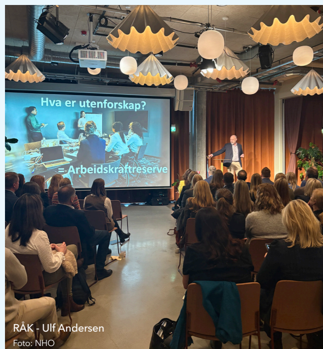
RÅK - Ulf Andersen