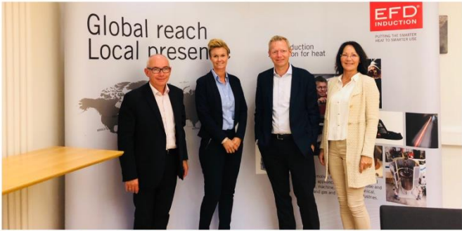
EFD Induction er et globalt konsern med hovedkontor i Skien.